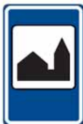
IJ 16 Silniční kaple

20. V příloze č. 3 bodu 5 písmeni c) se doplňuje vyobrazení a název značek „IJ 16 Silniční kaple“, „IJ 17a Truckpark“ a „IJ 17b Truckpark“.