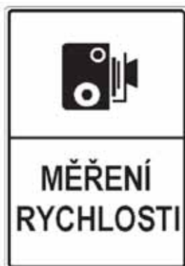
IP 31a Měření rychlosti

18. V příloze č. 3 bodu 5 písmeni a) se doplňují vyobrazení a názvy značek „IP 31a Měření rychlosti“ a „IP 31b Konec měření rychlosti“.