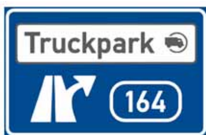
IJ 17a Truckpark