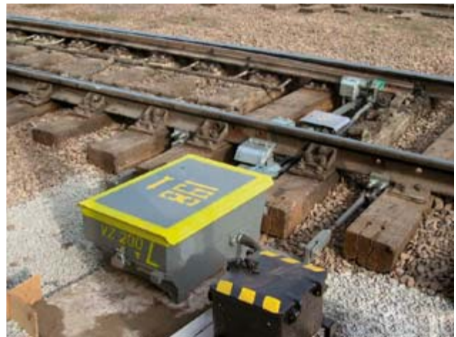
Kloubové upevnění přestavníku