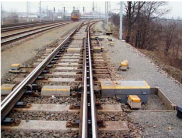
Uložení přestavníku ve žlabovém pražci